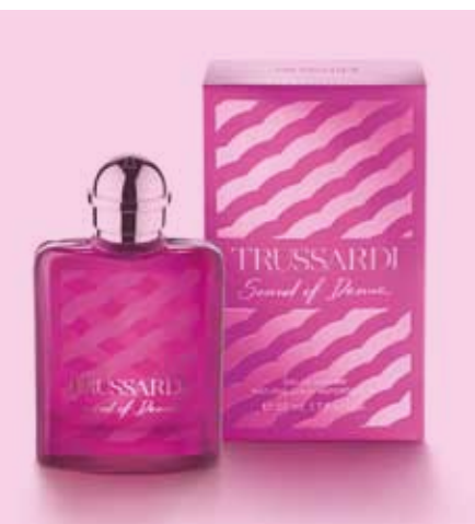
Sound of Donna Eau de Parfum, Spray von Trussardi

Der hochwertige Duft für moderne, anspruchsvolle Frauen ist mit seiner raffinierten Duftmischung der orientalischen Duftfamilie zuzuordnen, besitzt aber auch eine deutlich wahrnehmbare florale Komponente. Der Duft Sound of Donna stellt mit seinem eleganten Duftflakon aus pinkem Glas auch optisch eine Bereicherung im Döferegal dar. Der lang anhaltende, durchaus intensive Duft verleiht im Berufsalltag oder bei besonderen Freizeitanlässen blumige Frische und eine markant orientalische Würze.