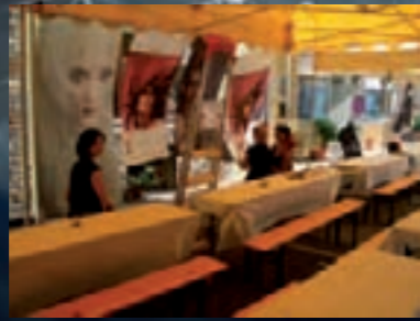
perfekte Teamwork beim Aufbau