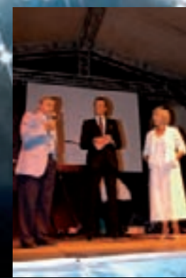
große Reden & viel Geschichte