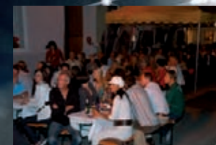
der Dorfplatz war voll!