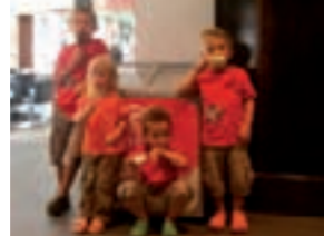
den Ostermann-Kids schmeckt!

war - nicht nur für die Kleinsten - die prall gefüllte Eskimo-Eistruhe mit hundert Mini-Magnum's. In dankenswerter Kooperation mit der Firma Sebastian.