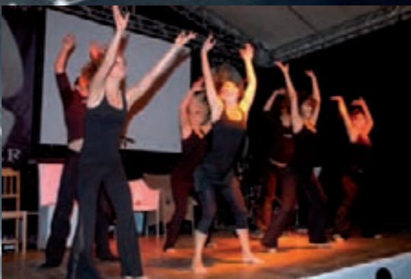
der Auftritt von „TANZAUFTRAG“ begeisterte