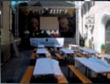
noch alles ganz harmlos