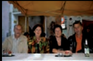
Fam. Plattner und Fam. Happ